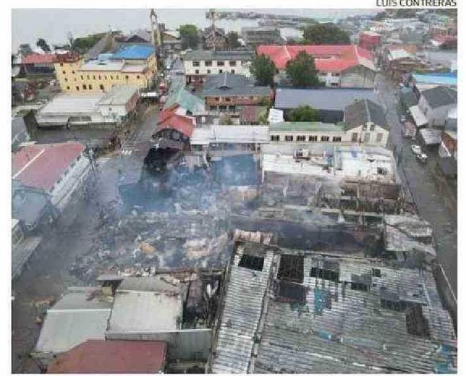
A LA LUZ DEL DÍA SE APRECIABA LA MAGNITUD DE LA EMERGENCIA.

“Ante el gran incendio en el centro comercial Paseo Plaza Ancud, en dicha comuna de la Isla de Chiloé, estamos trabajando para superar la emergencia y apoyar a los afectados. Al equipo de gobierno que está desde temprano (ayer) en terreno se sumará mañana (hoy) el ministro @JuanCaMuñozA”, escribió en su cuenta de la red