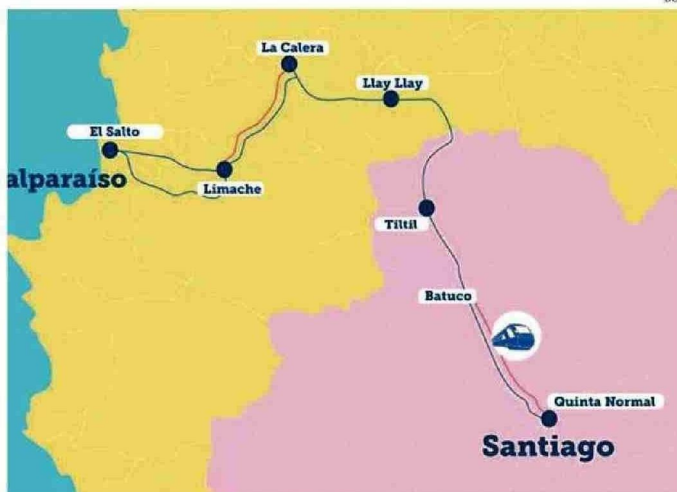
POSIBLE RUTA DE TREN VALPARAÍSO-SANTIAGO

Además, el MTT señaló que en paralelo y con el objetivo de avanzar en diversos frentes, están trabajando en materia de estrategias y tareas de demanda, además de evaluación social con el BID; esto, con el objetivo de entregar ante-