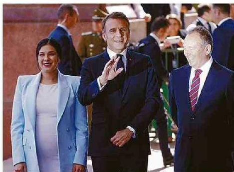
EN EL CONGRESO LO ACOMPAÑARON LOS PRESIDENTES DE AMBAS CÁMARAS.

marítimas protegidas y concluir este año un acuerdo internacional ambicioso y obligatorio para poner fin a la contaminación plástica. De aquí a junio que viene, tenemos que ratificar el Tratado sobre la Biodiversidad".