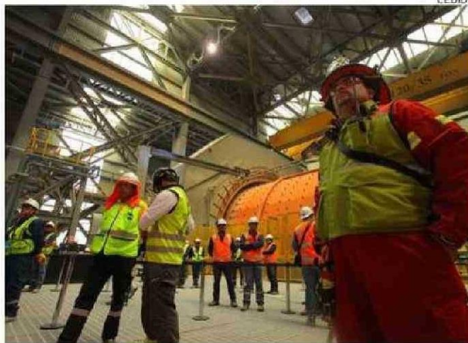
LAS EMPRESAS PRESENTARON SUS SOLUCIONES EN FORMATO PITCH.