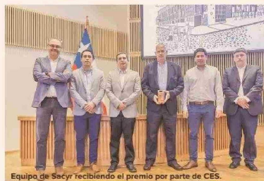
Equipo de Sacyr recibiendo el premio por parte de CES.