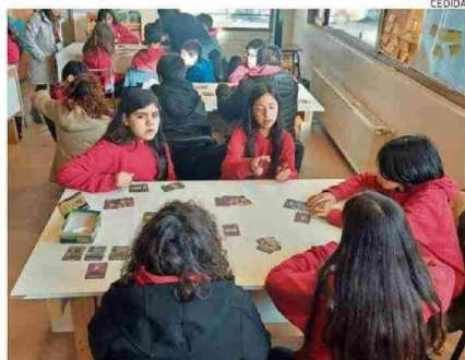
Alumnos del colegio Altamira de Coyhaique probaron el juego.

te que primero logre reunir cuatro "colecciones".