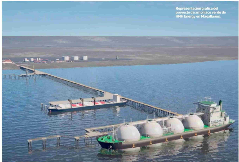
Representación gráfica del proyecto de amoníaco verde de HNH Energy en Magallanes.

El terminal se diseñó para permitir la exportación de amoníaco y el tránsito de carga general, lo que permitirá a la industria de la zona contar con esa infraestructura. “Dispondrá de la capacidad necesaria para prestar servicios a todo tipo de clientes y usuarios, pero es-