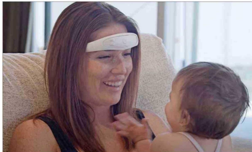
Los nuevos dispositivos de neuromodulación (en la foto) se usan tanto para tratar como para prevenir la migraña. En Chile ya hay uno disponible.