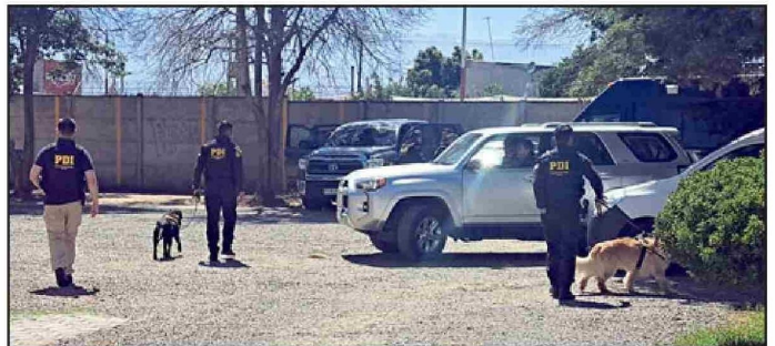
Durante la mañana del miércoles 13 se llevaron a cabo las diligencias pertinentes por parte de la PDI, con su equipo Tedax (Técnicos Especialistas en Desactivación de Artefactos Explosivos).