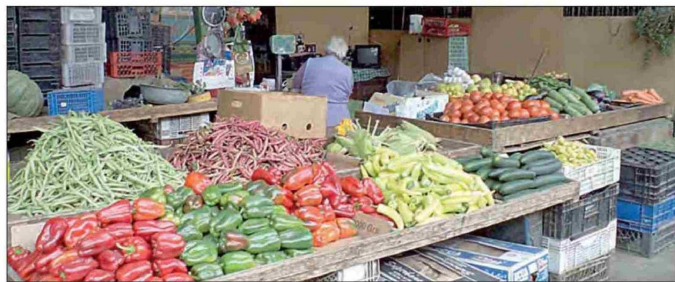
El precio de las frutas, verduras y hortalizas no necesariamente se verá afectado por las recientes lluvias, ya que la poca cantidad de cultivos producto de la sequía ya había elevado los valores.