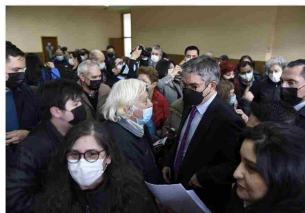
En agosto de 2022, el ministro de Hacienda Mario Marcel se comprometió en Punta Arenas con los jubilados del 4%.

Esta situación es profundamente injusta y requiere una reparación inmediata. No es sólo cuestión de cumplir un compromiso, sino de justicia y dignidad”.