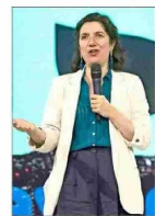
Reemplaza a Camila Vallejo, quien se va con prenatal.

Ariela Agosin, presidenta de la comunidad judía en Chile: “Cuando el líder más importante de Chile (el Presidente de la República) te trata mal, todos se sienten con licencia para tratarte mal”. | C 2