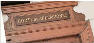
UNÁNIME —La decisión de la Corte de Apelaciones de Santiago se adoptó de manera unánime.

ló los motivos por los cuales procedió de esa forma”. Así, por estas y otras consideraciones, sostienen los jueces, “se rechaza, sin costas, el recurso de protección deducido por Fundación Fuerza Ciudadana contra la Contraloría General de la República”. Si bien, en 2018, el entonces contralor Jorge Bermúdez estableció un criterio mediante el cual se aplicaba la confianza legítima cuando un funcionario cumplía dos años en su puesto, es decir, que podía tener la legítima expectativa de que fuera renovado en su cargo al cabo de ese tiempo; pero, en no-