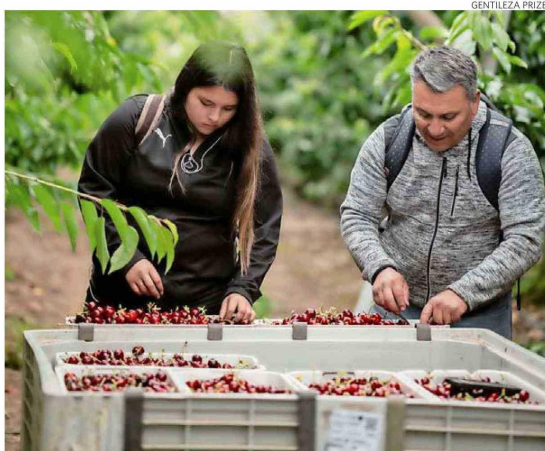
Esta semana marca el período de mayor cosecha en la temporada con el ingreso de las lapins y luego de las reginas.

Uno de los principales temores a nivel de embalaje no se cumplió. La aparición de la mosca de la fruta en Chimbarongo y parte de la Región Metropolitana ha obligado a cumplir protocolos de tratamientos de frío para la exportación a China para los productores y procesadores de esas zonas.