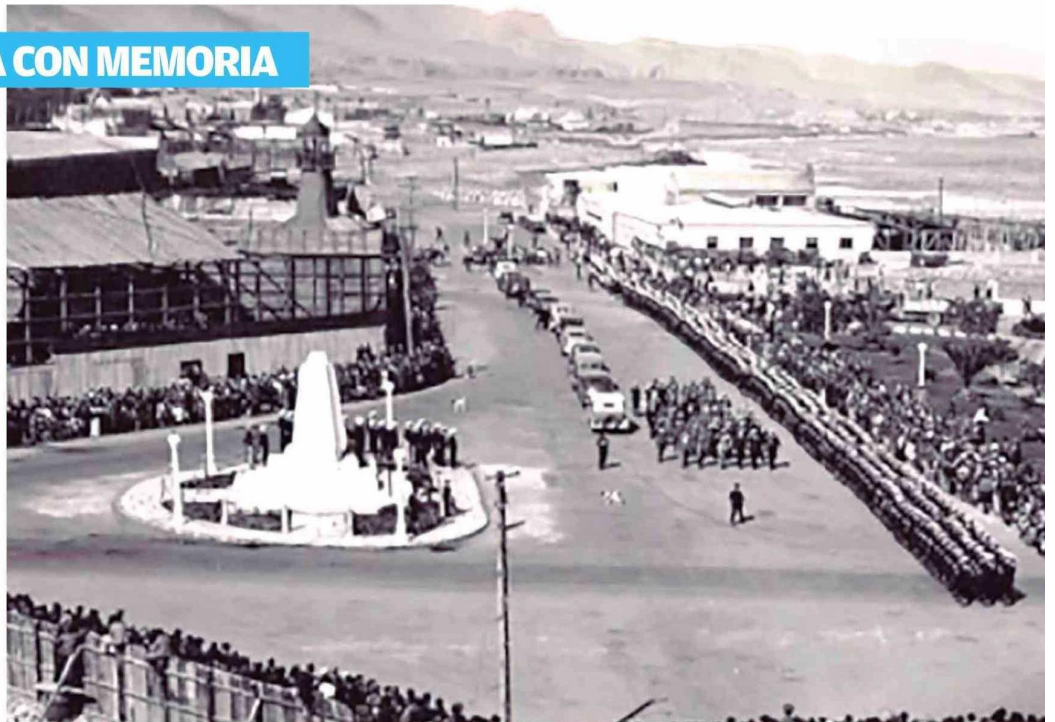
ACTO DE INAUGURACION DEL MONUMENTO “A LA PATRIA”.

El acto, calificado de solemne por los presentes y la Prensa, fue realizado el miércoles 9