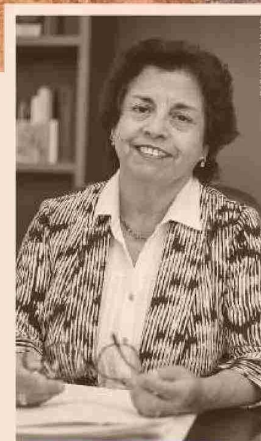
AURORA WILLIAMS, MINISTRA DE MINERÍA

La situación de las empresas se monitorea desde Sernageomin,