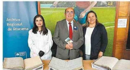
EL ARCHIVO REGIONAL MOSTRÓ SU INTERÉS POR COLABORAR.

“Esta actividad es parte de nuestro rol y compromiso con nuestra región, a través de la investigación, preservación y pue-