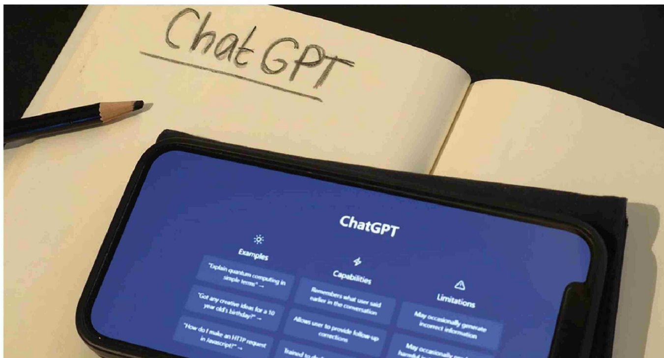
► En EvoAcademy, compañía dedicada a la capacitación en temas de tecnología e IA, puso a esta área a rendir la Prueba de Acceso a la Educación Superior (PAES).