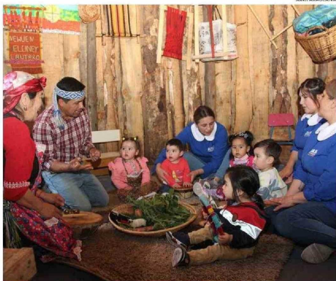
POR SU TRAYECTORIA, JUNJI SE HA CONVERTIDO EN UN REFERENTE EN EDUCACIÓN INICIAL DE CALIDAD EN CHILE Y LATINOAMÉRICA.

CONMEMORACIÓN. En este nuevo aniversario la institución desarrollará diferentes actividades en La Araucanía.