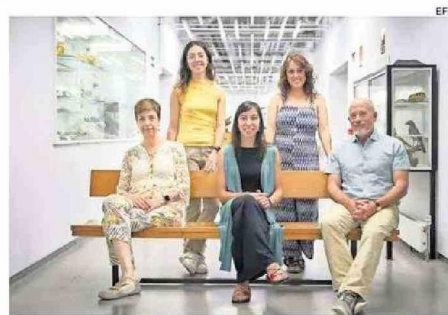
EL EQUIPO CIENTÍFICO QUE REALIZÓ EL ESTUDIO.

Aunque este engrosamiento está relacionado con varios