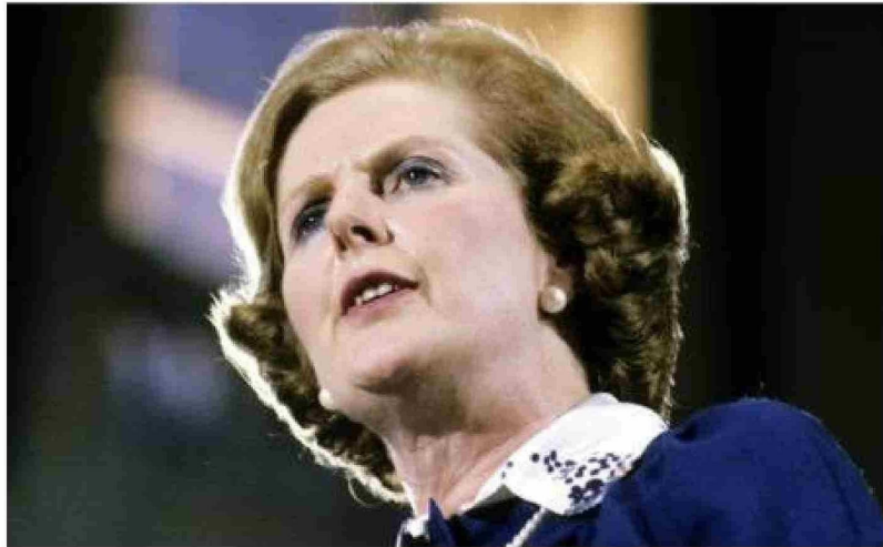
La líder conservadora Margaret Thatcher.

El movimiento huelguista de los mineros de hace cuatro décadas tiene una historia poco conocida que, tal vez, merezca