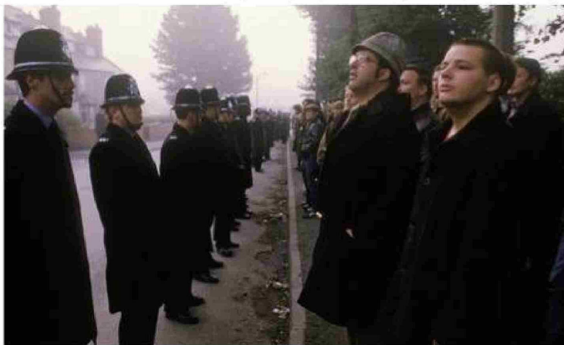
Policías cuidan que los huelguistas no bajen de la vereda a la calle.

La huelga fue declarada ilegal porque lo permitía un recurso, un atajo, un pretexto. Una legislación aprobada por los conservadores obligaba a los trabajadores a que aprobaran una huelga por votación, casi en referéndum, para que fuese legal. El NUM no votó la huelga, fue el voto de los mineros locales y regionales los que la aprobaron, pero no la central sindical por lo que la huelga tal vez era