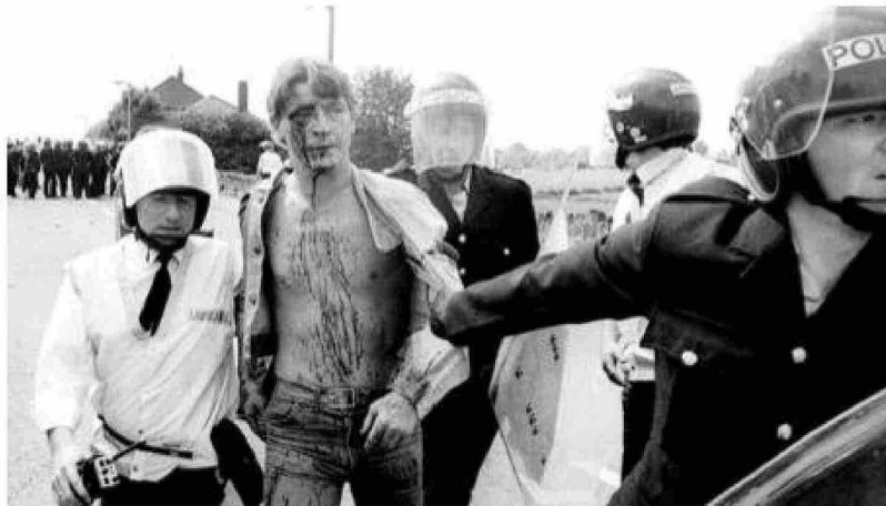
La "Batalla de Orgreave" en Sheffield, Gran Bretaña, durante la huelga minera de 1984.

tomada por estrecha mayoría. La central obrera tenía sus activos congelados y los mineros huelguistas dependían cada vez más de contribuciones voluntarias. Hubo una, de un millón de dólares, que fue anulada: provenía del futuro líder de la Unión Soviética, Mikhail Gorbachov, a quien advirtieron que su solidaridad con los mineros huelguistas podía traerle dificultades en el futuro entendimiento con los líderes europeos. La política del "Informe Ridley" aplicada por Thatcher hizo que las centrales eléctricas que atesoraban el carbón almacenado, permanecieran abiertas durante el invierno 1984-1985.