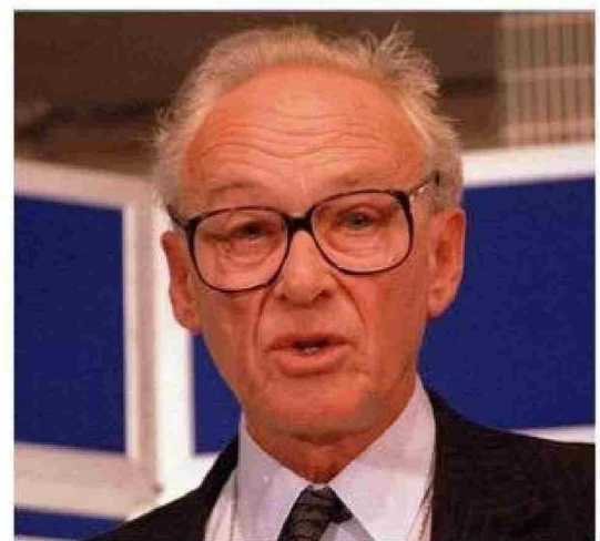
Nicholas Ridley, el ideólogo de las políticas de Thatcher sobre los sindicatos.