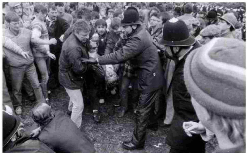
La policía se lleva un minero herido durante la llamada Batalla de Orgreave entre huelguistas y las fuerzas de seguridad en 1984.