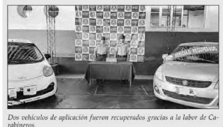
Dos vehículos de aplicación fueron recuperados gracias a la labor de Carabineros.