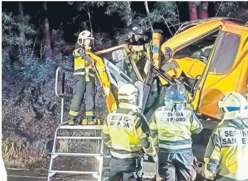
EL CAMIÓN NO PUDO ELUDIR AL ÁBOL QUE CAYÓ DESDE UN CERRO ALEDAÑO A LA RUTA.