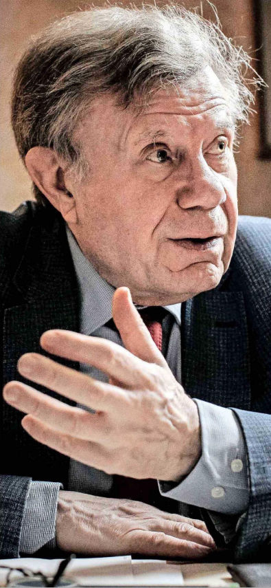
Roger Chartier es autor de "El mundo como representación" y "El orden de los libros".

Referente de la Escuela de los Annales, el historiador francés afirma que la cultura digital es un hito mayor que la invención del códex y de la imprenta, y advierte que pone en riesgo el estatuto del conocimiento. Sin embargo, cree que es posible, con educación, recuperar el sueño de una comunicación universal. El jueves, en Santiago, dictará la charla "Humanidades, humanismo, humanidad".