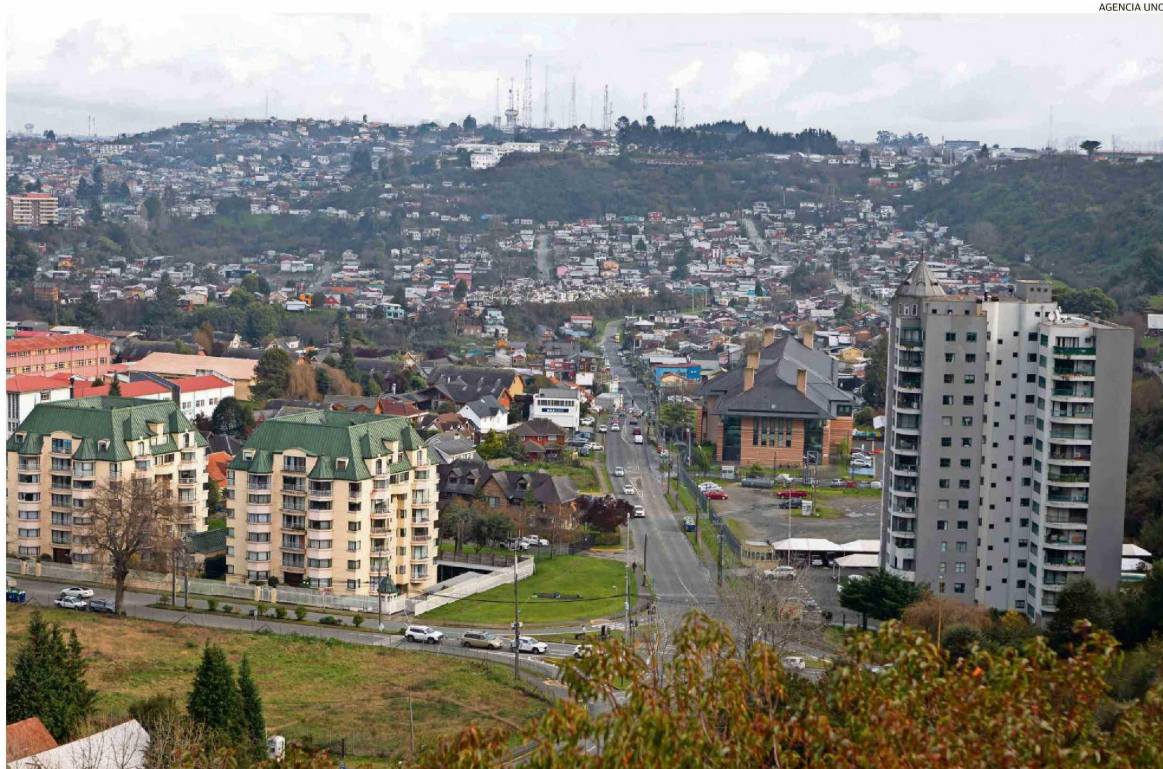
EL ALCALDE DE PUERTO MONTT, GERVOY PAREDES, PROYECTA QUE LA COMUNA LLEGARÁ A LOS 280 MIL HABITANTES EN ESTE CENSO.

Entonces, admite, “se observa el cambio en cuanto a la cantidad de personas que habitan el territorio. Pero no se tiene el dato duro. Por ello, el Censo entregará las certezas que nos permitirán ir adecuando las necesidades de cada territorio, de manera que el plan de inversiones sea ajustado en