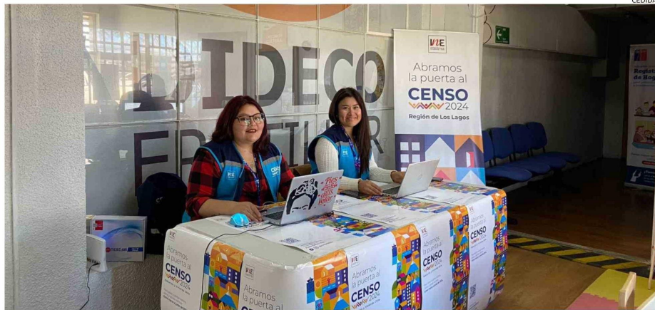
LA FASE EN TERRENO DEL CENSO EN 26 COMUNAS DE LA REGIÓN CONCLUYÓ ESTA SEMANA. AHORA LOS INTERESADOS PUEDEN ACERCARSE A PUNTOS HABILITADOS, PARA REALIZAR EL TRÁMITE SI ES QUE NO LO HAN EFECTUADO.