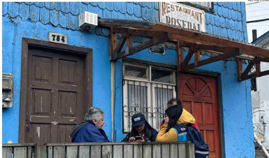
CASTRO ES UNA DE LAS COMUNAS DONDE EXTENDIÓ EL CENSO POR UN MES Y DONDE SE PROYECTA UN CRECIMIENTO POBLACIONAL.