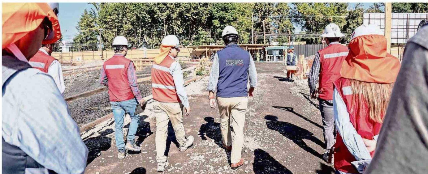
LA INICIATIVA ES FINANCIADA ÍNTEGRAMENTE POR EL GOBIERNO REGIONAL E IMPLICA UNA INVERSIÓN TOTAL DE $13 MIL MILLONES.