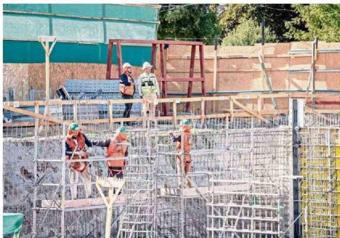
EL NUEVO CENTRO DE REHABILITACIÓN PERMITIRÁ QUE CERCA DE MIL FAMILIAS RECIBAN ATENCIÓN EN ÑUBLE.