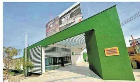
LA SUBCOMISARÍA PEDRO LEÓN GALLO PRONTO SERÁ ENTREGADA.