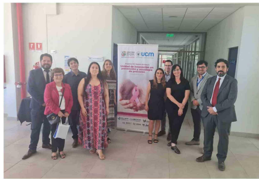
Equipo multidisciplinario del Programa Regional de Cáncer Hereditario, académicos de la Facultad de Medicina UCM, seremi de Salud de la Región del Maule y colaboradores internacionales de Argentina (LUNCuvo, HEMA y Conicet) y Francia (Centro Oncológico Georges François Leclerc).

mejorar los tratamientos y también hacer una intervención mayor en los núcleos familiares. "El proyecto, además, tiene un componente innovador en esta iniciativa que estamos apoyando con mucho entusiasmo", enfatiza. Subraya que este programa es un real aporte a la comunidad. "Es una contribución que comienza haciéndonos cargo de una realidad, a través de un tratamiento adecuado. Evidentemente, es un aporte a la comunidad, considerando que estamos implementando medidas para aliviar la situación compleja que significa saber que uno padece cáncer de mama. Este proyecto nos ayudará a seguir tomando decisiones que nos permitan avanzar en algo esencial que es una mejor salud para todos y todas", sostiene el gobernador regional de Atacama. Esta alianza, acogida por el Hospital Regional de Copiapó, tiene la colaboración de la comunidad y de organizaciones locales, fundamentales para el éxito de este programa. La