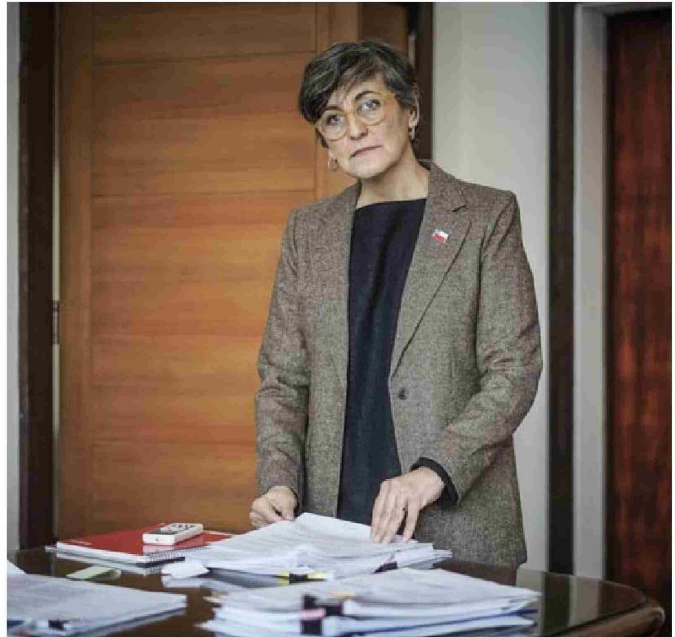
► Ximena Aguilera, ministra de Salud.

Y detalla que "un tema sobre el cual también conversamos es que necesitamos un sistema único de salud que no garantice sólo el acceso, sino también la calidad y que esa calidad no dependa del presupuesto que tiene cada familia". ●