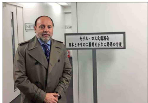
En la Cancillería de Japón, antes de dictar una conferencia, en 2015.

—Habrán tenido vínculos. "En la historiografía, y lo planteaban varios de los colegas con quienes me formé, se decía que, avanzado el siglo XIX, todos estos grupos convergían a ser uno solo. Mi investigación empírica, con 2.400 nombres, dice que la ten-