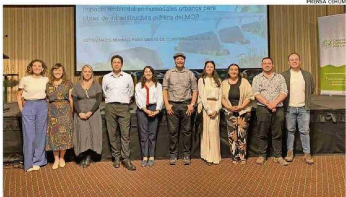
EL EQUIPO DEL CENTRO DE HUMEDALES TRABAJÓ EN LA INICIATIVA PRESENTADA PARA EL MOP.

El estudio consideró el análisis de más de 2 mil contratos de obras del MOP, teniendo en