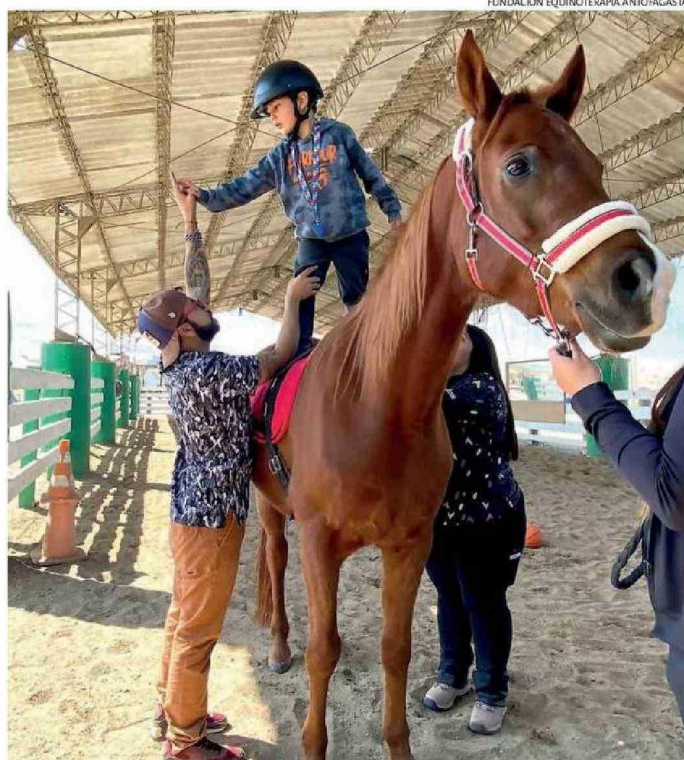
ACTUALMENTE LA FUNDACIÓN ATIENDE A CERCA DE 150 PACIENTES DE FORMA GRATUITA, LO QUE PODRÍA CAMBIAR PRÓXIMAMENTE.

La directora agrega que esta campaña de captar empresas, socios, o personas naturales que quieran apoyar la fundación, nació de la misma preocupación de los padres, los que incluso ya están organizan-