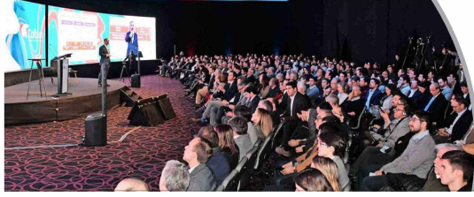
Voces con Energía 2024 de Colbún se realizó este miércoles en el Hotel W Santiago.