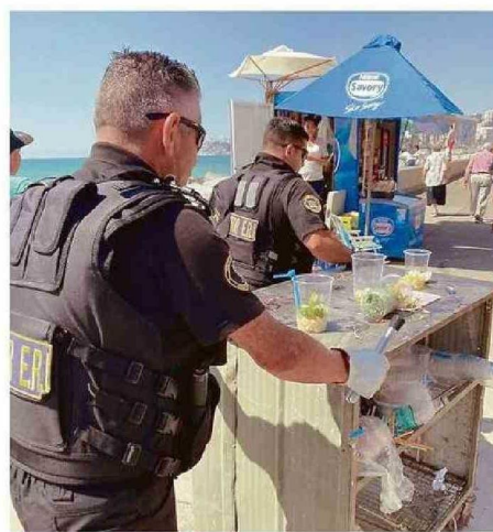
RETIRO DE CARROS Y COMERCIO AMBULANTE ILEGALES EN AV. PERÚ

Sin embargo, los vecinos consideran que estas medidas son insuficientes. “Si los operativos fueran diarios, los vendedores ilegales se aburrirían y no