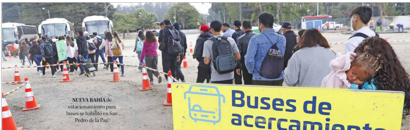
NUEVA BAHÍA de estacionamiento para buses se habilitó en San Pedro de la Paz.