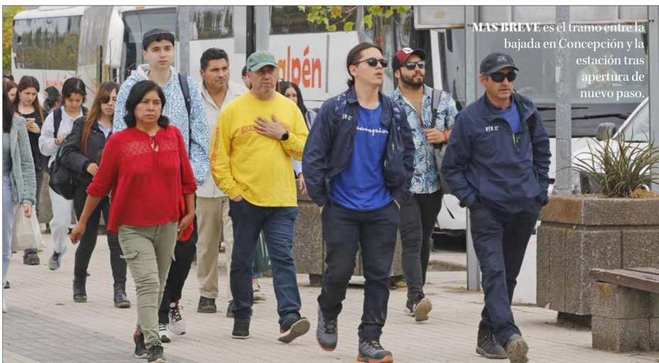
MÁS BREVE es el tramo entre la bajada en Concepción y la estación tras apertura de nuevo paso.