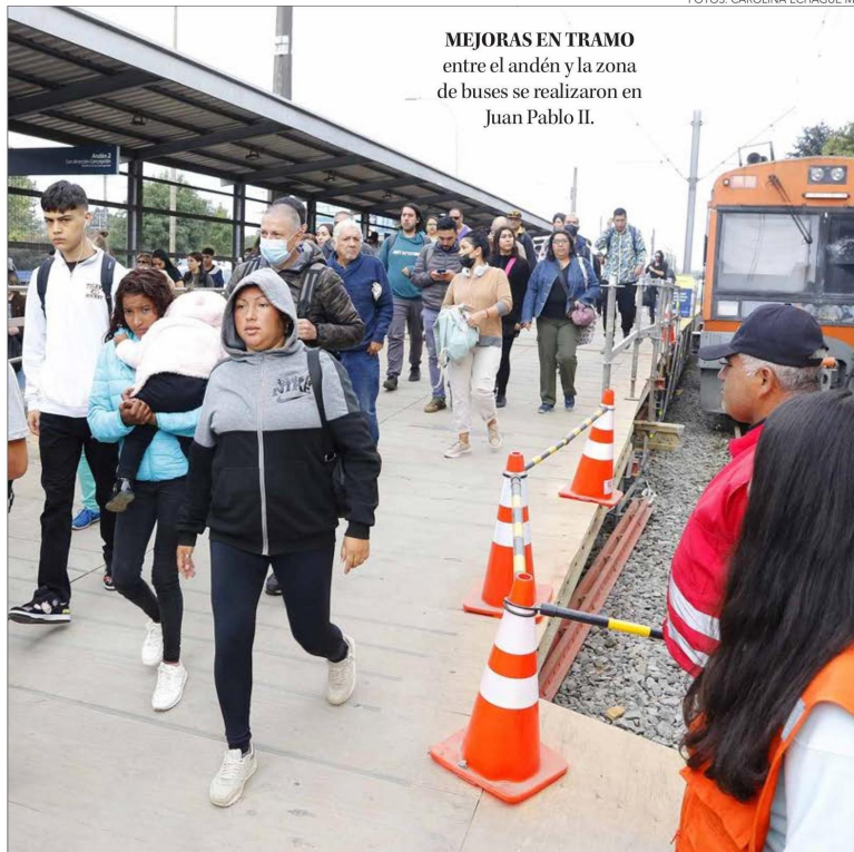
MEJORAS EN TRAMO entre el andén y la zona de buses se realizaron en Juan Pablo II.