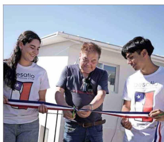
Desafío Levantemos Chile ha construido 72 viviendas a familias afectadas.