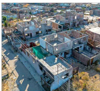
Ayer en Valparaíso, el Ministerio de la Vivienda actualizó a 78 las viviendas entregadas a los damnificados.