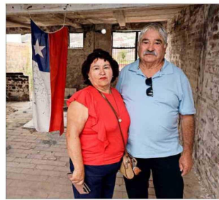
Tener una segunda vivienda inhabilita a un tercio de los dueños de las propiedades que resultaron destruidas.

La Seremi Minvu de Valparaíso admite que para flexibilizar esta situación hay una propuesta de modificar la norma que fija esta restricción, "la que tiene que pasar por la Contraloría y está en distintas revisiones".