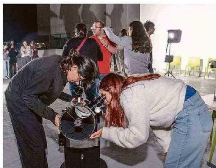
TAMBIÉN MEDIANTE EL USO DE TELESCOPIOS.

mos la suerte de tener un cielo despejado y con poca turbulencia atmosférica". Gracias a ello, los participantes lograron observar los planetas Marte, Júpiter, Saturno y Venus.