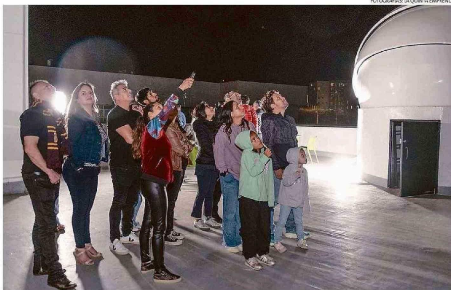
LOS ASISTENTES PUDIERON REALIZAR OBSERVACIÓN DE ESTRELLAS Y PLANETAS A OJO DESNUDO.

de enero en la noche se realizó el evento denominado "Gala Astronómica".