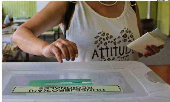
LAS ELECCIONES EN TODO EL PAÍS SE REALIZARÁN EL DOMINGO 24 DE OCTUBRE, CON VOTO OBLIGATORIO.