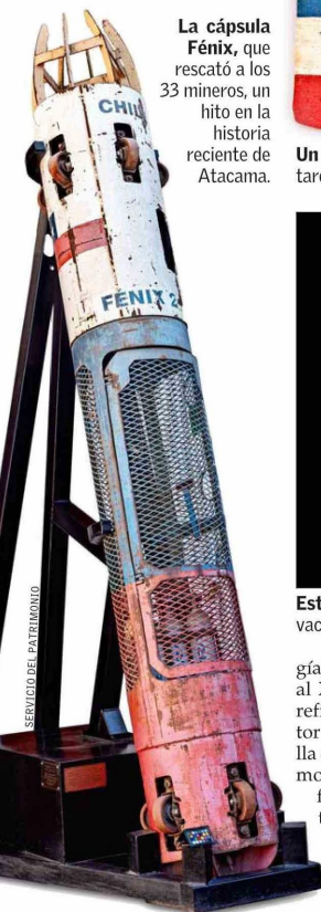
La cápsula Fénix, que rescató a los 33 mineros, un hito en la historia reciente de Atacama.