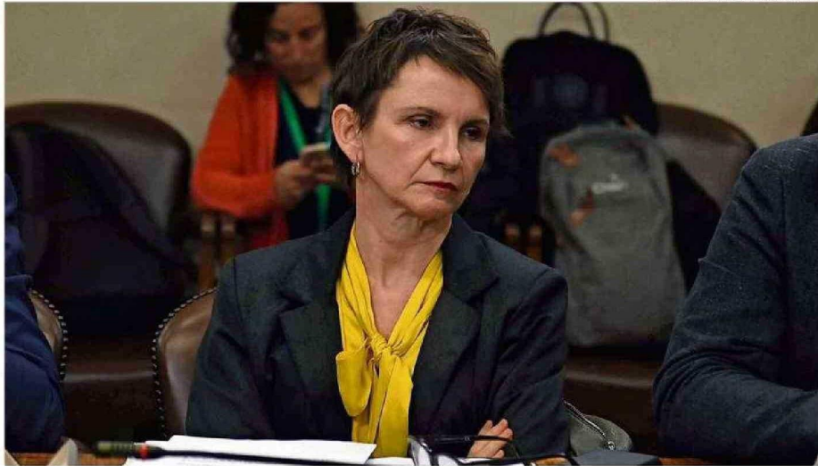
LA MINISTRA DEL INTERIOR ACONSEJÓ “EXTENDER LOS HORARIOS” DE FUNCIONAMIENTO DEL CONGRESO.

“Casos de corrupción permanentemente se están analizando, pero casos de corrupción en donde se mencionaban abogados ligados al Ministerio del Interior, jueces de la Corte Suprema (Ángela Vivanco, Jean Pierre Matus, Sergio Muñoz y Mario Carroza), exministros del Interior (Andrés Chadwick), es de una gravedad mayor, por lo tanto acá cada institución, (...) todos tenemos que hacer nuestra parte”, destacó la secretaria de Estado en