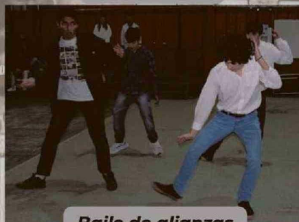
Baile de alianzas