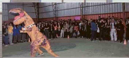
Competencia de mascotas de cada alianza