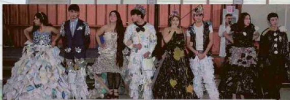
Desfile de Moda de trajes reciclados