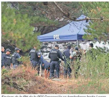
Equipos de la BH de la PDI Concepción se trasladaron hasta Lengua para periciar un cuerpo encontrado, posiblemente vinculado al hecho.

do una nave auxiliar con seis personas en su interior vivas y una fallecida. Se recabó la información de que la embarcación Magdalena II había sido siniestrada, producto de un volcamiento en primera instancia, ante lo cual lo-