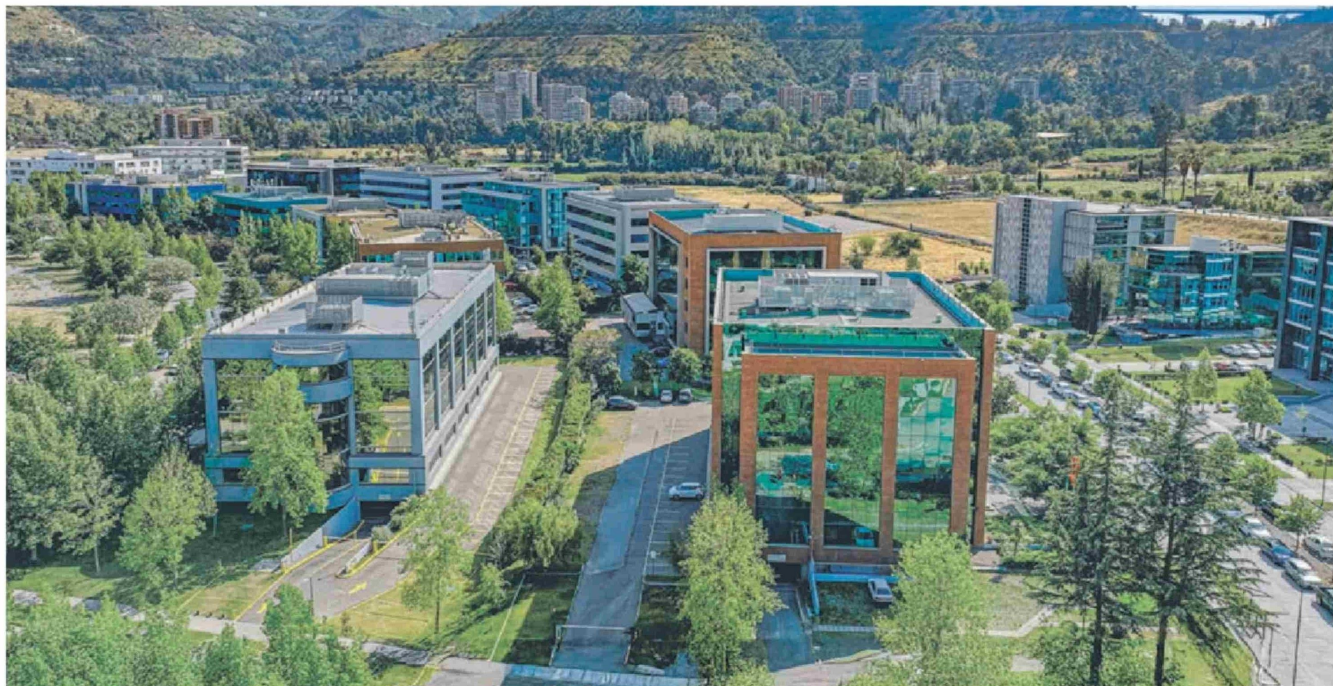
El nuevo campus Ciudad Universitaria, en Huechuraba, de la Universidad San Sebastián, consta de cinco modernos edificios para gestión, docencia e investigación.

L a Universidad San Sebastián (USS) ha seguido su plan de inversiones en infraestructura para el mejor desarrollo de sus actividades. En ese marco, anunció la inversión de US$ 65 millones que incluyen la apertura del campus Ciudad Universitaria, en Huechuraba; la construcción de un nuevo edificio en el campus Paicaví en Concepción; y la habilitación de un segundo Centro de Salud docente-asistencial en Valdivia.