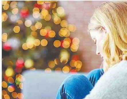
BRINDAR COMPañÍA A QUIEN VIVE UN DUELO POR ESTAS FECHAS.