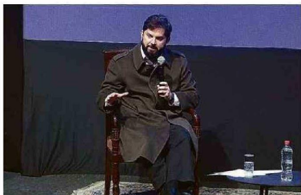
Presidente Boric rechaza el mote de "estallido delincencial" para 18-O Pág. 11

Valparaíso. Docentes, trabajadores y apoderados emplazan al ministro Nicolás Cataldo por estado de las escuelas, colegios y liceos porteños. Pág. 5