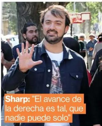
Sharp: "El avance de la derecha es tal, que nadie puede solo"