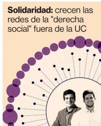
Solidaridad: crecen las redes de la "derecha social" fuera de la UC