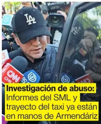
Investigación de abuso: Informes del SML y trayecto del taxi ya están en manos de Armendáriz