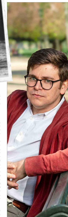
"Donoso nunca transitó en su visión de la literatura como un arte autónomo. No estuvo dispuesto a simplificar su lenguaje o su imaginario", dice Joaquín Castillo.

Su apuesta por la perennidad, ante todo estética, parece haber sido una elección acertada, si lo comparamos con la vigencia de otras figuras del boom como Fuentes o Cabrera Infante".