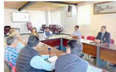
Los representantes de la Red de Emergencia, junto con expertos en la materia, presentaron un plan de acción con medidas preventivas y de respuesta ante incendios forestales.

la empresa... Y ser garantes que vamos a respaldar todas las acciones tendientes a prevenir, pero también buscar responsables. La colaboración entre todos los actores involucrados es esencial para mitigar este riesgo y evitar que estos incendios se sigan repitiendo", acotó el jefe comunal. Asimismo, el jefe comunal reafirmó su compromiso con la comunidad, y aseguró que se continuará trabajando de manera intensiva para solucionar esta problemática, que ha afectado a miles de personas en la ciudad.