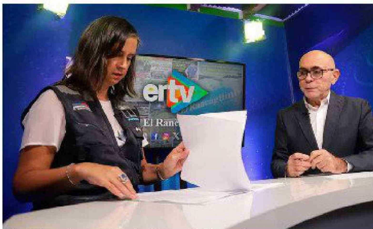
La alta funcionaria gubernamental aseguró que "la exportación de cerezas ha aumentado", y que el año pasado fue un año récord en exportaciones frutícola.

Cuando se le consultó sobre las medidas y la guerra comercial del presidente de EEUU, Donald Trump, si afectaría la exportación de la fruta chilena, la autoridad de Agricultura, subrayó que "es algo que estamos monitoreando", y que la semana pasada sostuvieron una reunión con todos los agregados agrícolas que están en distintos países, a quienes se les pidió "especial preocupación" y prioridad en este tema. Sobre las repercusiones