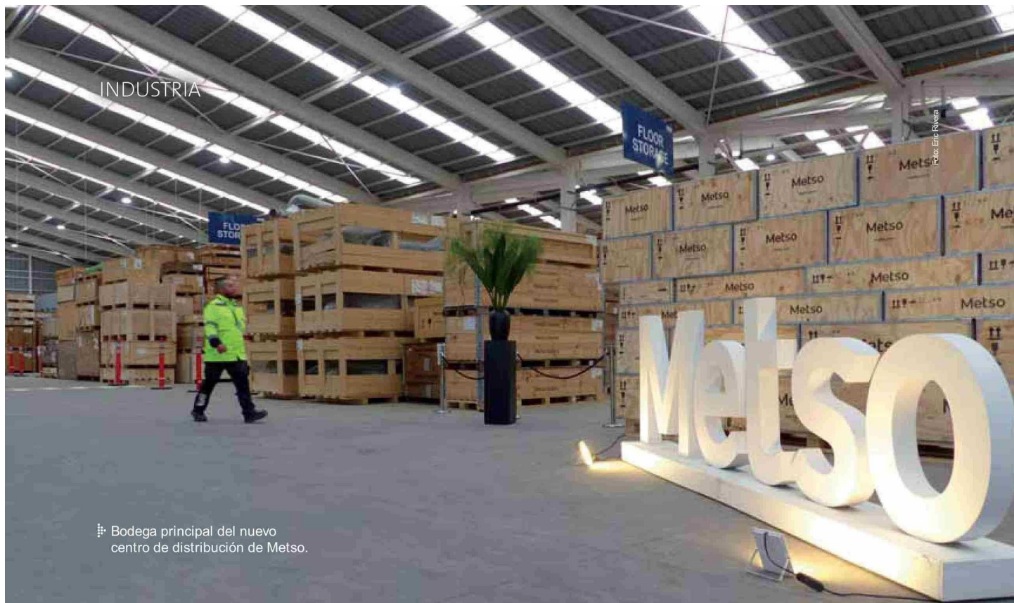
📍 Bodega principal del nuevo centro de distribución de Metso.